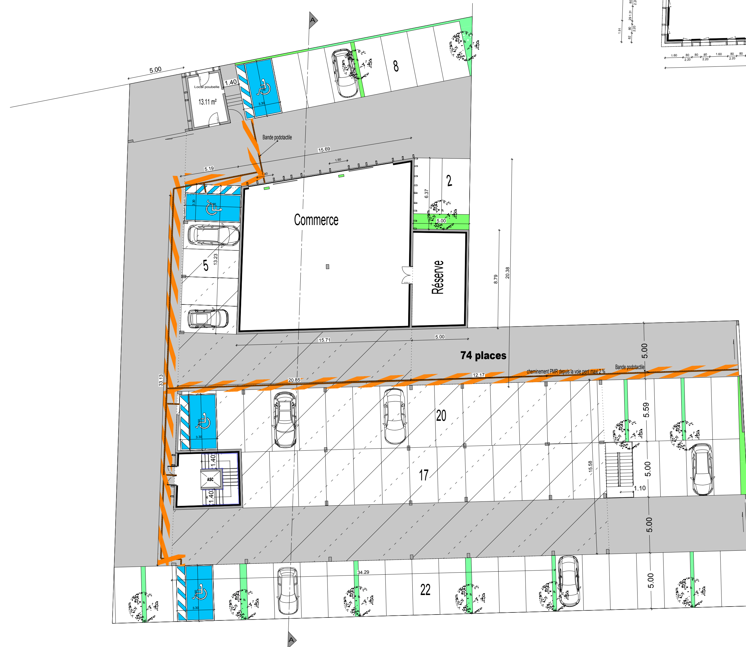
REZ DE CHAUSSEE pc 39 et 40